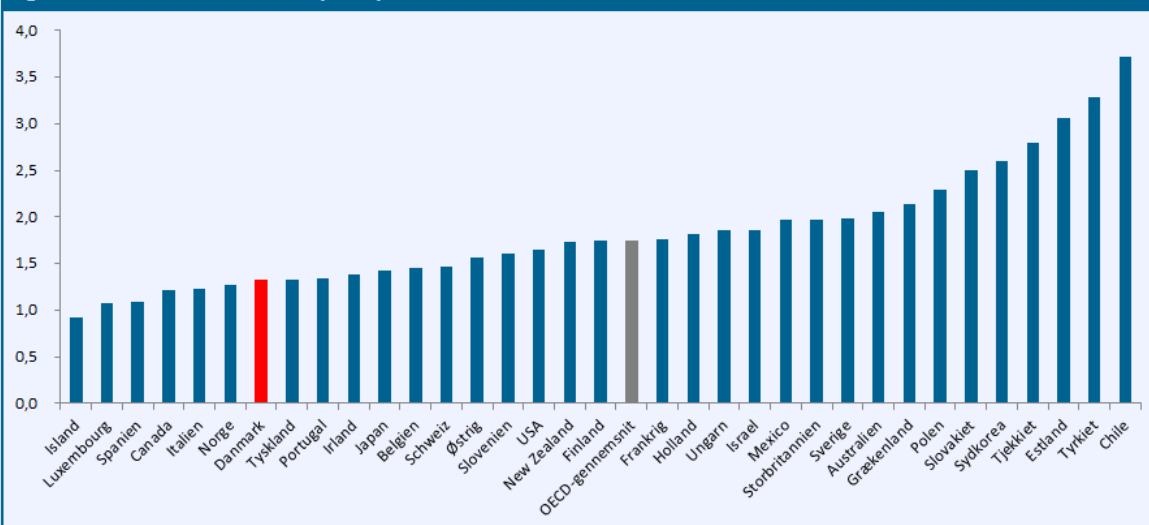
Figur 2. Potentiel vækst i BNP pr. capita, OECD 2014-2030

Korrigeres væksten for befolkningsudviklingen, udgør den danske gennemsnitlige årlige potentielle BNP-vækst 1,3 pct. frem mod 2030. Det er lavere end OECD-gennemsnittet (1,7 pct.) og lavere end i Sverige (2,0 pct.) og Finland (1,7 pct.). Norge får en lavere vækst end Danmark, da de har en høj befolkningsvækst, jf. figur 2.