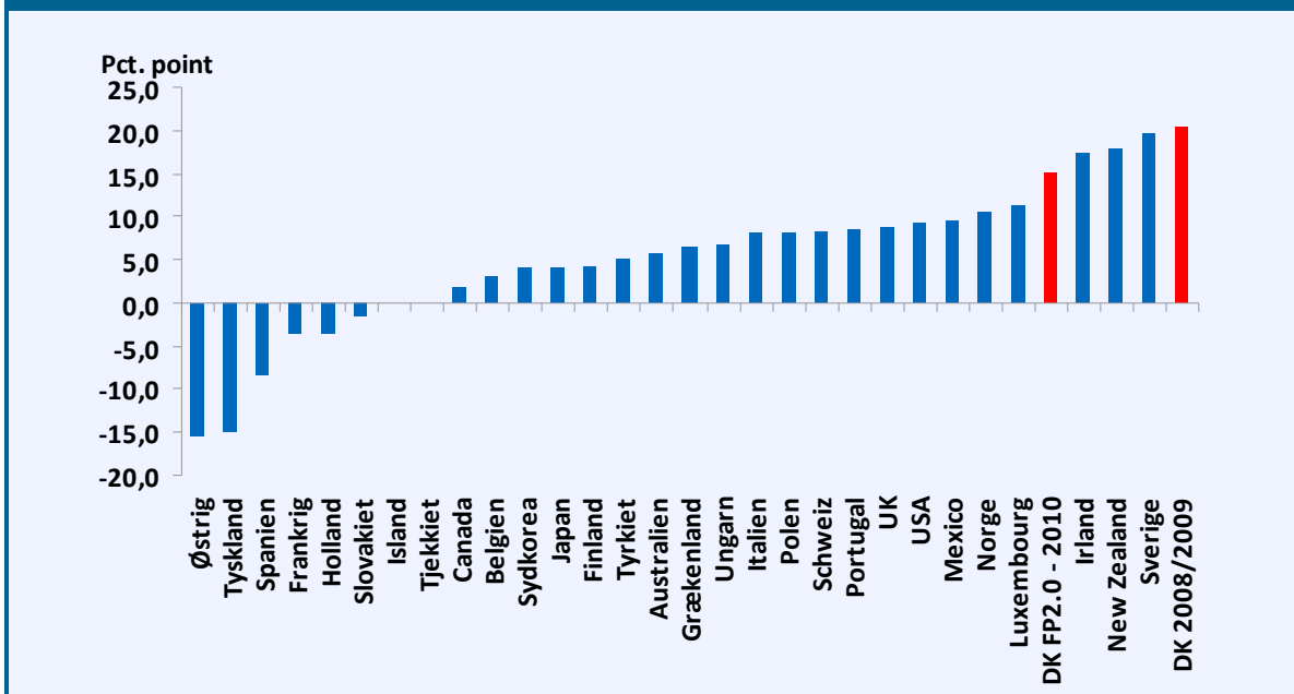
Figur 3. Forskel i marginalsat mellem højt lønnet og lavt lønnet i 2008/2009, OECD-lande

Anm.: "Lavtlønnet" angiver her en løn på 67 pct. af en gennemsnitlig industriarbejder, mens "højt lønnet" er 167 pct. heraf. DK FP2.0 - 2010 angiver forskellen i Danmark i 2010 efter at Forårspakke 2.0 er gennemført.