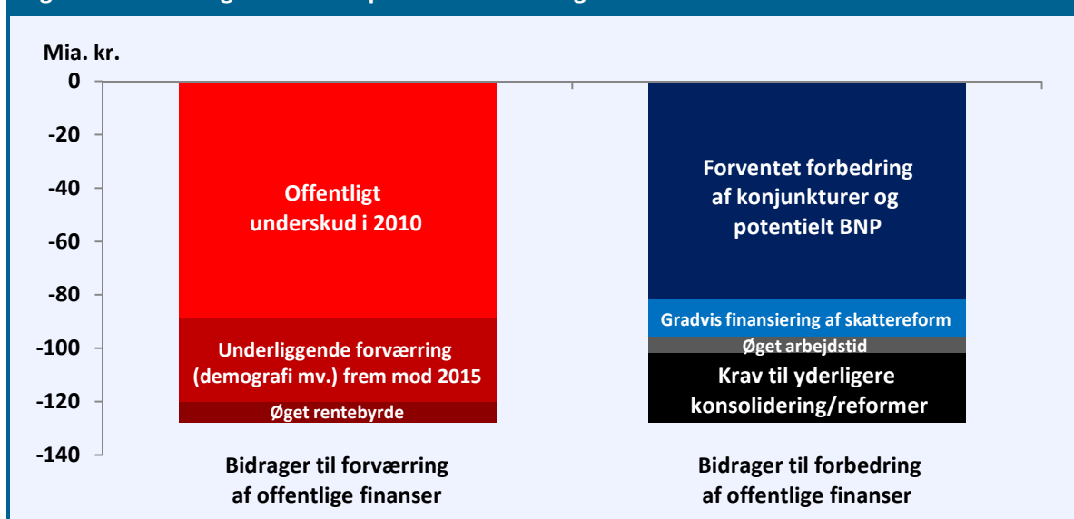
Figur 2. Håndtering af de finanspolitiske udfordringer fra 2010 til 2015